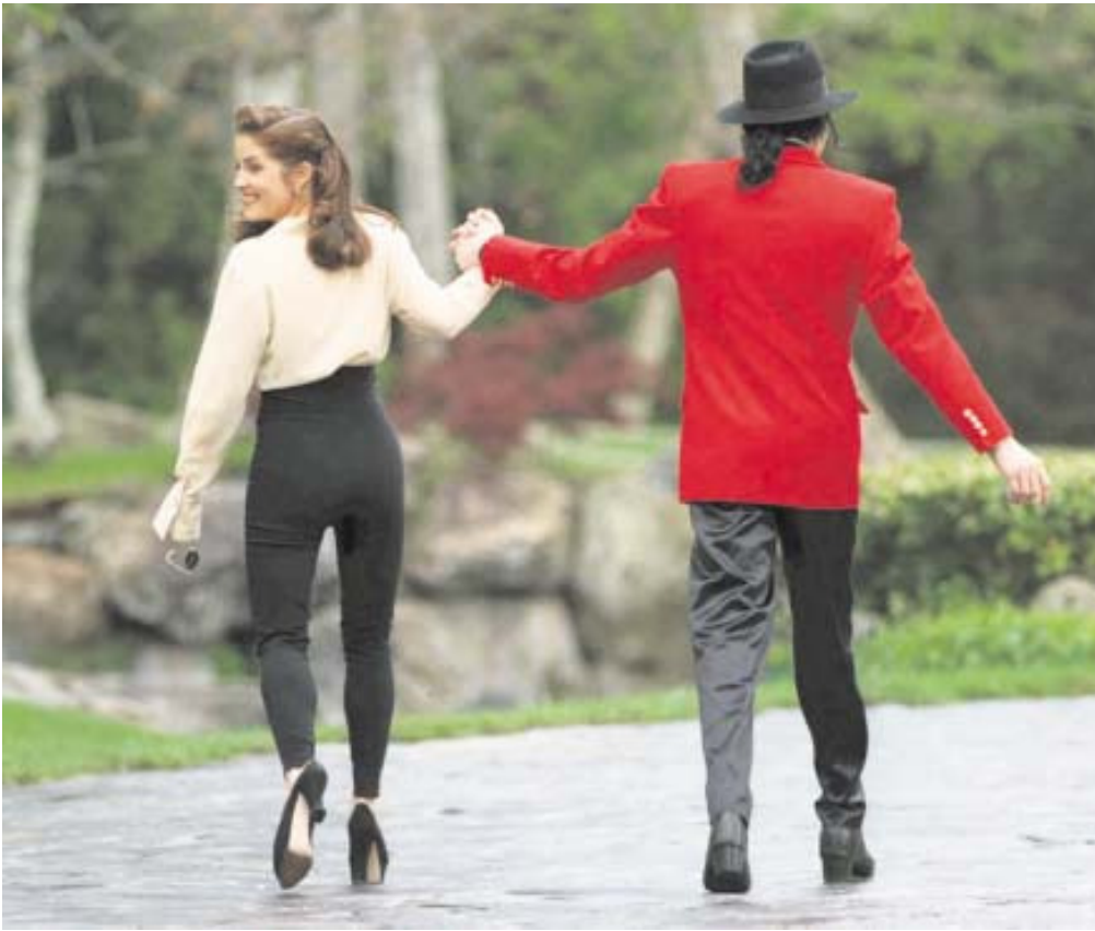
Die Distanz ist unübersehbar: Elvis-Tochter Lisa Marie...... und der King of Pop führten eine seltsame Ehe.