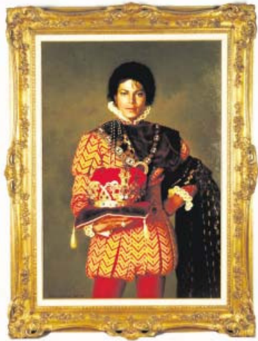
Der Klassiker: der King of Pop.

2009: Im März kündigt Jackson eine Serie von Comeback-Konzerten an. Im Mai werden diese zum Teil verschoben. Sein Management bestreitet gesundheitliche Probleme, seine Gesundheit sei „fantastisch“. Am 25. Juni stirbt Jackson in Los Angeles.