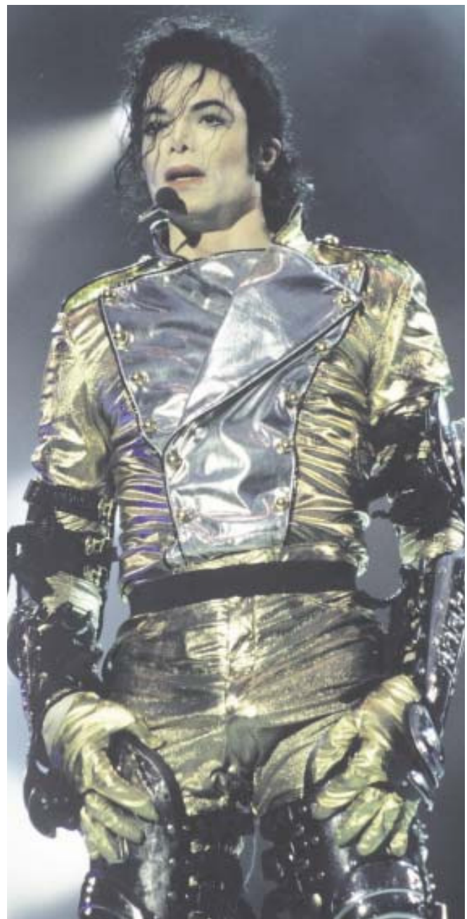
Jackson in Gold: 1997 auf seiner letzten Tour durch Deutschland.