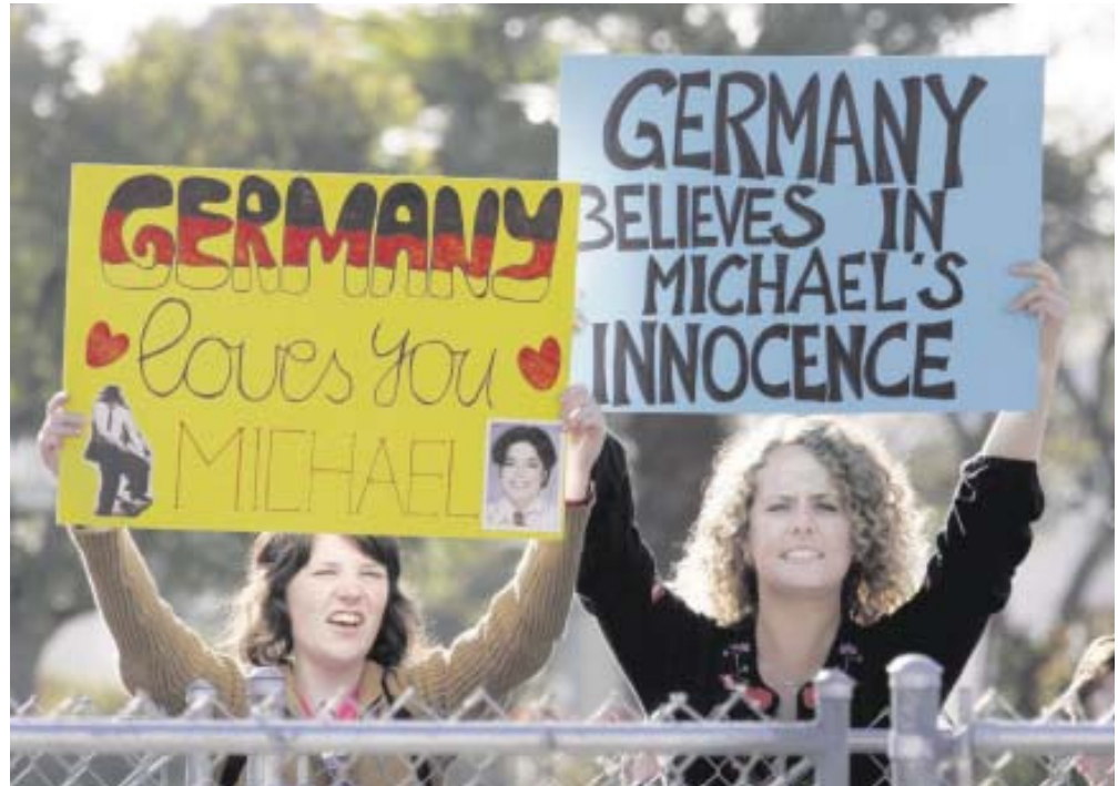
Sie konnten es damals nicht glauben und können es heute wieder nicht: Deutsche Fans lieben „Jacko“.