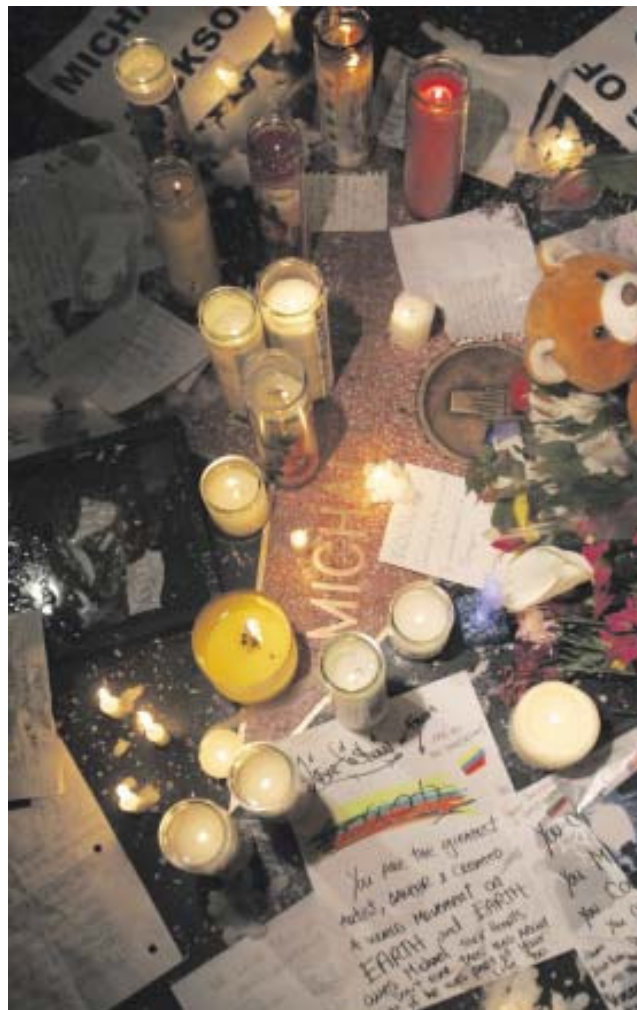
Fans in Los Angeles entzündeten Kerzen als Zeichen ihrer Trauer.

Er hatte den Rhythmus der schwarzen Getto-Tänzer und die Eleganz eines Fred Astaire, schwärmte der Kritiker