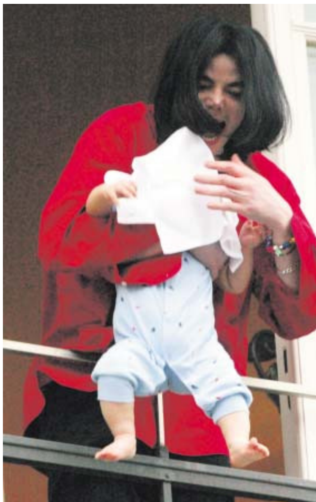
Gefährlicher Leichtsinns: „Jacko“ hält in Berlin ein Kind aus dem Fenster.

Die Musikindustrie folgt dem Aufschwung. Die Leute haben Geld, immer mehr Geld, es lässt sich leben, und die Leute, gerade die jungen, wollen feiern, auch die schwarze Jugend. Joe Jackson sieht seine Chance. Er drillt fünf seiner Jungs gnadenlos. Fünf Brüder sind sie, fünf Show-Stars sollen sie werden, die Jackson Five, 1965 gründet Vater Joe die wohl erste Boy-Group der Welt: Jackie, Tito, Jermaine, Marlon und eben Michael. Er, das zweitjüngste von zehn Kin-