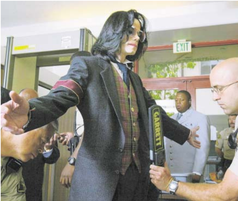
Auf Waffen wurde Michael Jackson im Gerichtsgebäude von Santa Maria durchsucht.