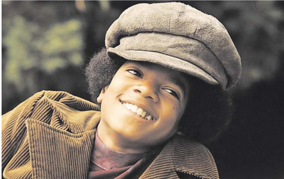
Michael Jackson startete seine Karriere im Alter von fünf Jahren, wurde schnell mit seinen Geschwistern bei „Jackson Five“ weltberühmt.