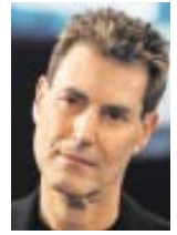
Uri Geller Illusionist und Jacksons Freund

Ich bin am Boden zerstört und sehr, sehr traurig. Jackson war 2001 mein Trauzeuge. Ich bete für ihn.