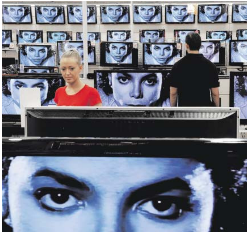
Nach Jacksons Tod laufen seine Videos auf allen Kanälen: Blick in einen Bochumer Elektrohandel am Freitag.