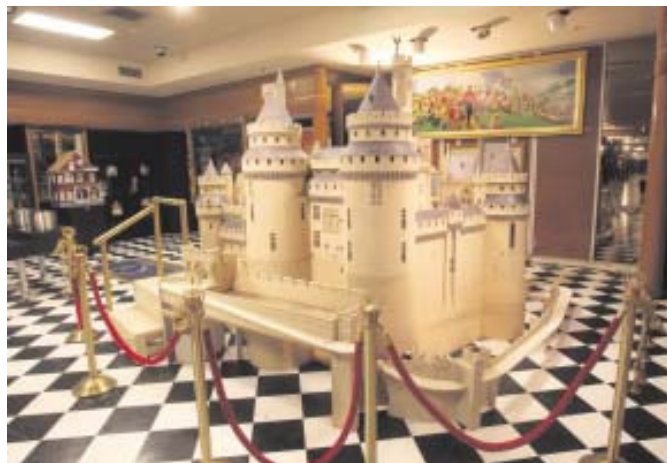
Für diese Modellburg muss man lange basteln. Bei der - abgesagten - Versteigerung sollte sie zwischen 2000 und 4000 Euro kosten.