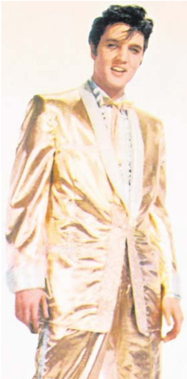
Ein Maßstab für Jacko, ebenfalls im goldenen Aufzug: Elvis.

Auch Elvis, der ja sein Schwiegervater geworden wäre, wenn er nicht mit 42 seine letzten Gitarrengriffe getan hätte, gehört zu den Giganten, die musikalisch mehr bewirkt haben als Michael Jackson. Und doch hatte ja auch Elvis den Zenit seiner Karriere längst überschritten, als er starb. Der „King of Rock“ wurde nicht einmal so alt wie der „King of Pop“. So überlagert bei Elvis bis heute der Ruhm und die beinahe göttliche Größe seiner frühen Jahre alles, was das Bild später trüben sollte, die deprimierende Antriebslosigkeit, das Übergewicht und die Weltflucht, die Drogen- und Medikamentensucht, die Traurigkeit der letzten Comeback-Versuche.