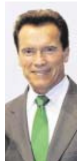
Arnold Schwarzenegger Gouverneur Kaliforniens

Er war eine der einflussreichsten Figuren der Musikbranche. Wie alle Kalifornier sind meine Frau und ich traurig und schockiert.