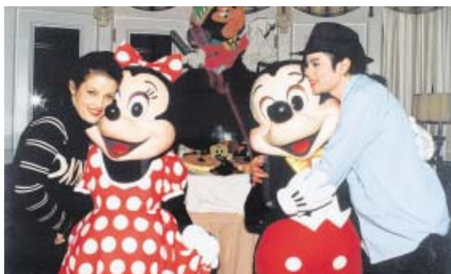
1994: Flitterwochen mit Lisa Marie Presley im Pariser Disneyland.