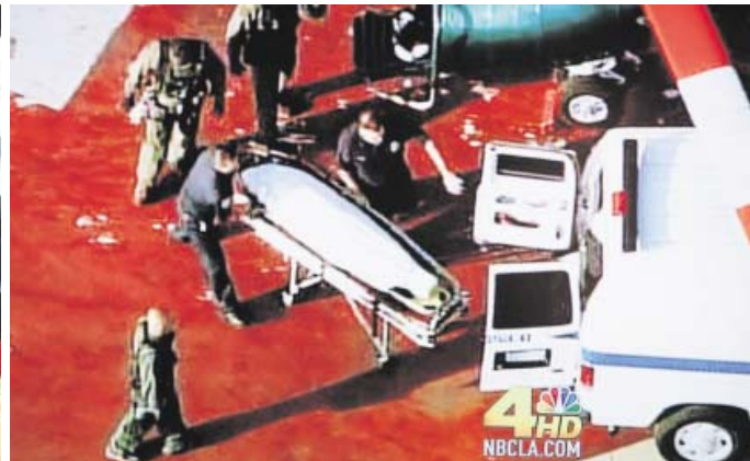
Das Ende: Ronald Reagan Hospital, Los Angeles, Jackson ist tot.