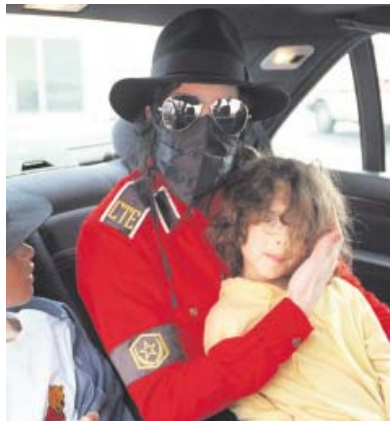
Problematische Beziehungen zu kleinen Jungs.