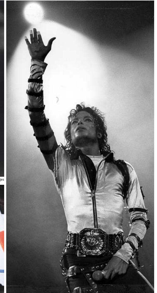
Beim Konzert im Gelsenkirchener Parkstadion 1988.