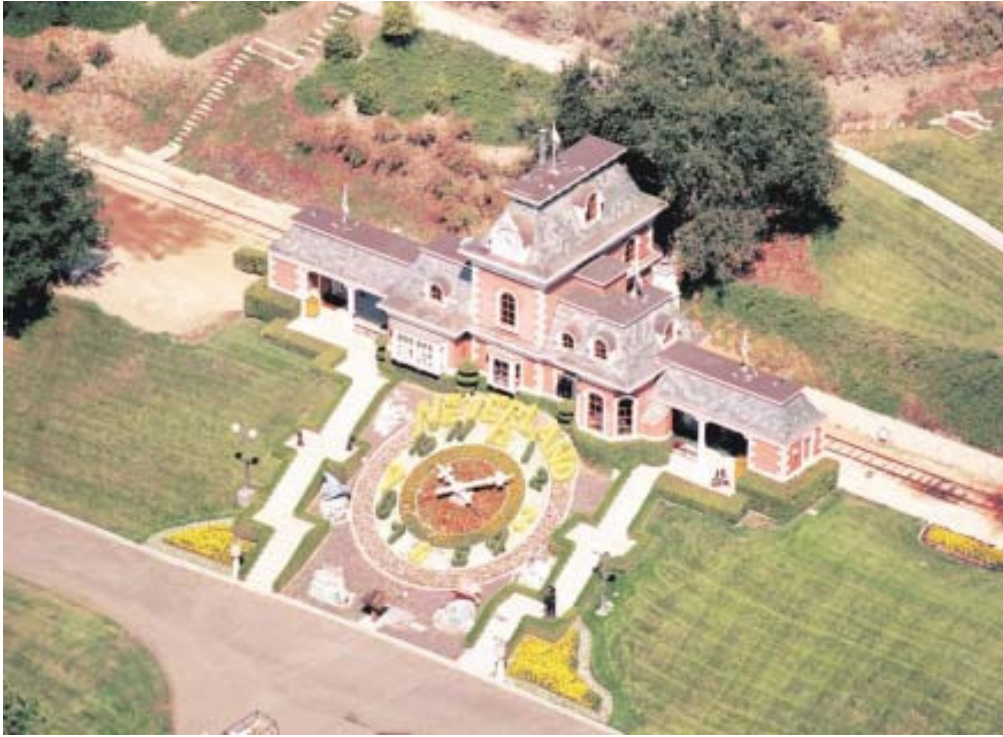
Großer Maßstab, um sich wieder klein zu fühlen: die Ranch Neverland.

Die Ranch „Neverland“ als elf Quadratkilometer große Ersatzkindheit